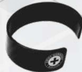
Elektromog Harmonisierungs Armreif aus Carbon