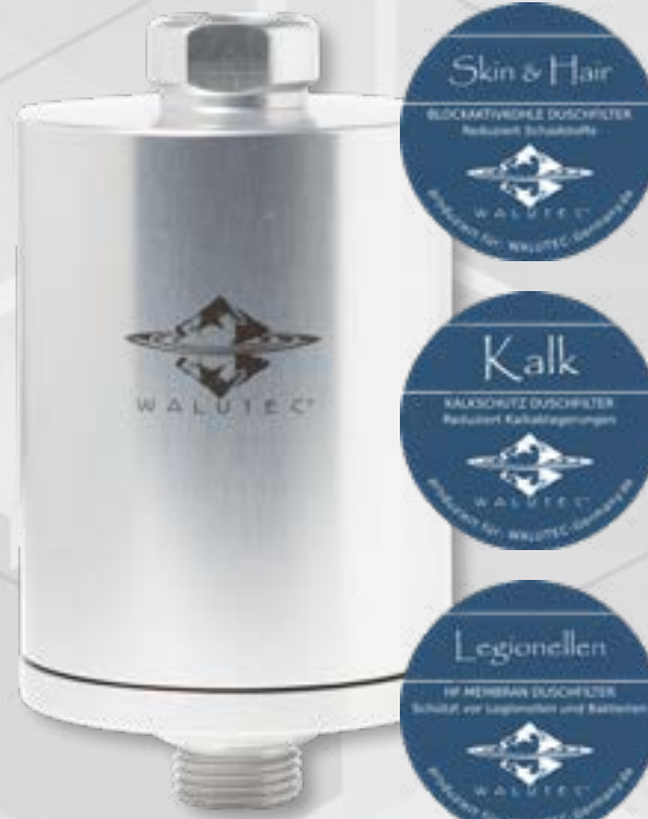
Duschfilter / Campingfilter