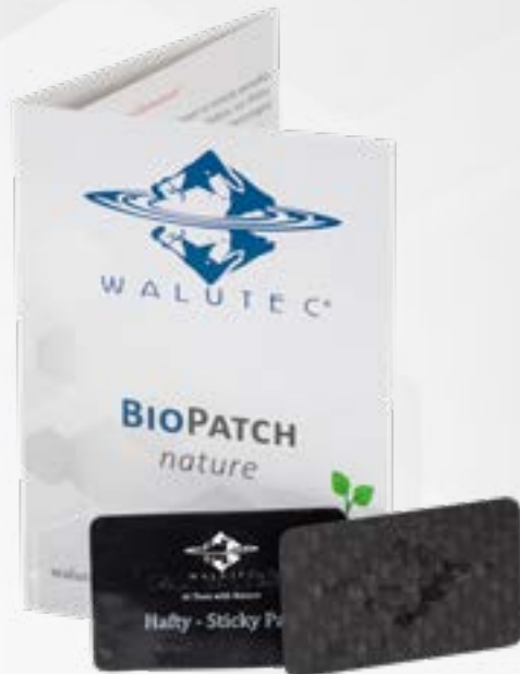
Handy Elektromog Harmonisierung